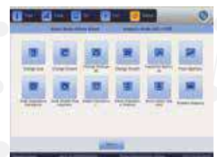
ENTRETIEN DU SYSTÈME